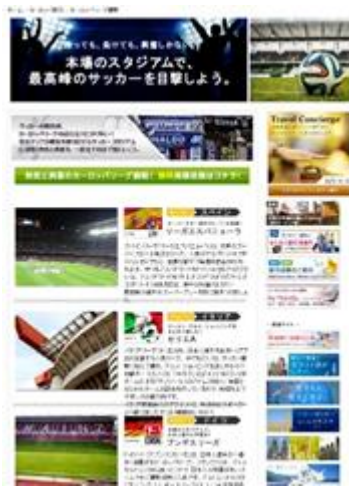
6月『サッカーヨーロッパリーグ観戦』