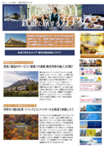
7月『鉄道で旅するカナダ』