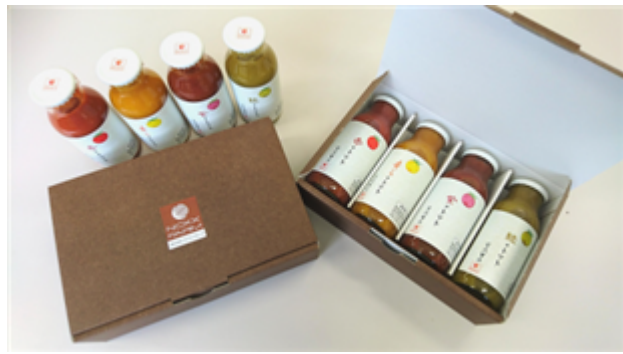
4色の色の100%トマトジュース ギフトセット

「フランチャイズ事業」では、自社園場におきまして定期的にフランチャイズ事業の説明会を開催し、地方自治体や各種農業関連の団体などから研修の一環として活用していただくなどの対応を継続しております。また、テレビ岩手、岩手めんこいテレビなどのメディアへの露出の反響もあり、問い合わせも増加しております。