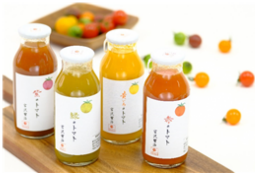
4色の色の100%トマトジュース(180ml)