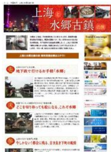
8月『上海と水郷古鎮の旅』

一方、「トラベルコンシェルジュ」の登録数も順調に推移しており、コンシェルジュが旅行以外の特技を生かせる場としてクラウドソーシング事業を展開し、優秀な人材確保に努めております。具体的には、グロリアツアーズの旅行業務のサポートおよび株式会社フィスコの情報配信業務や株式会社フィスコIRのIRニュースのショートコメントの作成及びインバウンド専用ページでの翻訳業務などで、コンシェルジュの特技を生かした様々な業務の委託は、帰属意識を高める施策として今後も取り組んでまいります。