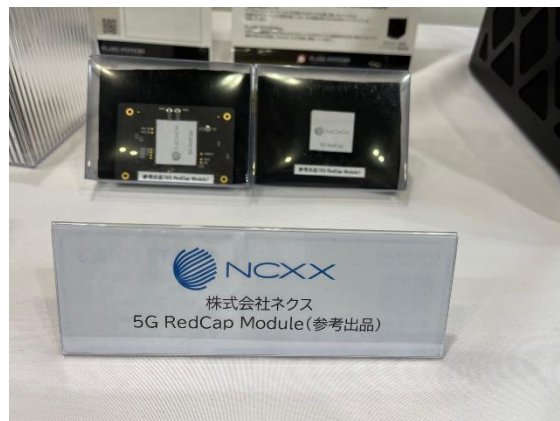
< 5G RedCap モジュール参考出品 >