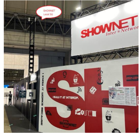
< ShowNet 提供ローカル 5G を用いた UNX-05G 4K カメラ映像伝送動態展示の様子 >

NEC ネットエスアイ株式会社 / 株式会社 FLARE SYSTEMS ブースでは、小型・低消費電力・低コストを実現する IoT 機器向けの 5G 仕様「RedCap」実装に向けた取り組みについてパネルを用いた展示と、「RedCap」対応通信モジュールを参考出品いたしました。