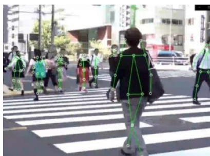
<混雑状況や動線の把握、防犯>