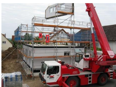
<建設現場における監視、危険検知>