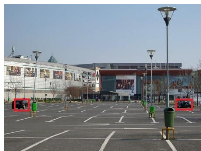
<駐車場の利用状況の把握、防犯>