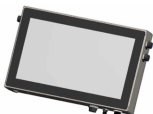
<産業用ファンレス PC STIMP001>