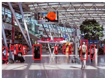
<混雑状況や動線の把握>