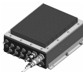
<産業用ファンレスタッチパネル PC STIPP001>