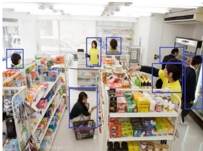
<顧客属性分析、購買分析、防犯>